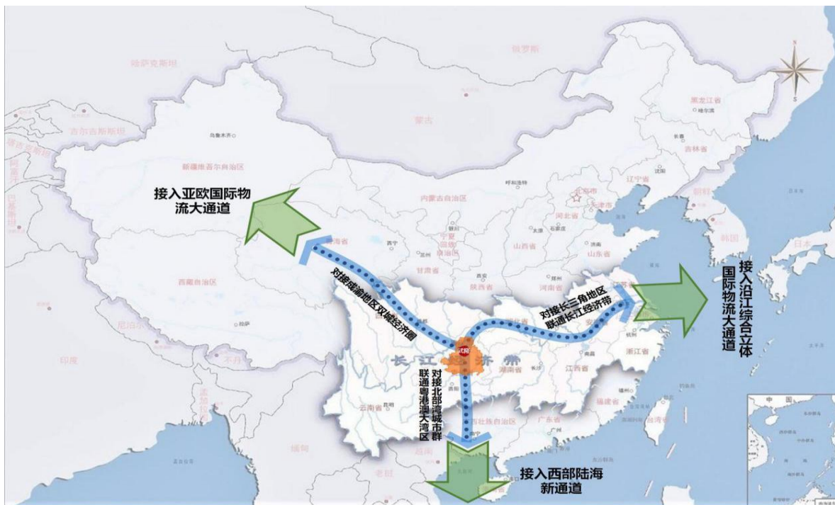
图3 武隆区主要物流通道示意图

际物流大通道；东向对接长三角地区、联通长江经济带，接入沿江综合立体国际物流大通道；对接南向北部湾城市群、联通粤港澳大湾区，接入西部陆海新通道。融入全球航空物流大通道网，加快丰富仙女山机场航线网络，强化与重庆江北国际机场、黔江机场合作，积极对接国内各大航司，积极筹划仙女山机场扩建和临时开放，打造国际旅游航空枢纽，接入连通全国、辐射全球的航空物流大通道网络。对接渝东南、渝东北、黔北等周边地区，形成物资集散分拨配送的区域性物流通道。