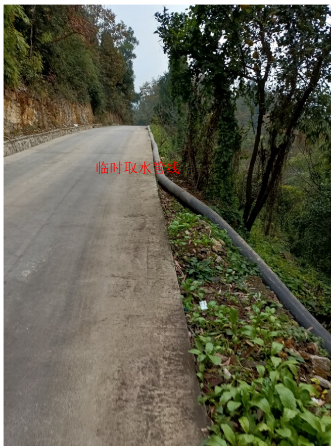
图 2.2-3 压裂供水临时软管敷设示例图

本项目对新钻的 3 口井水平段分段进行水力压裂，每段长约 100m，每段压裂用水量约 2000m 3 ，每天平均压裂 2 段，需水量约 4000m 3 /d，采用临时软管从莽子溪水库取水，在平台可采用“软体罐+配液罐+废水池”中转储存，最大储存能力 4900m 3 ，满足压裂用水储存要求。